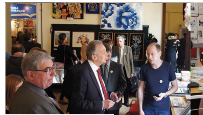
У стенда редакции газеты «ПВ»