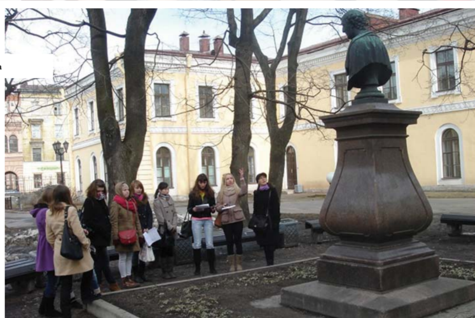
Экскурсия на английском языке по территории РГПУ им. А.И. Герцена