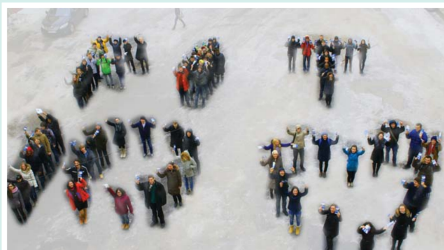
Флешмоб к десятилетью факультета

– На базе факультета функционирует научно-образовательный центр «Информационные технологии и системы моделирования», в рамках которого проводятся научные исследования, связанные с использованием информационных технологий. Совместно с институтом информатизации образования РАО функционирует научная лаборатория, деятельность которой включена в план работ Института информатиза-