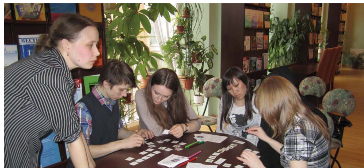
Вечер немецкого языка в зимнем саду Фундаментальной библиотеки университета

можно смело утверждать, что в этом событии проявляется переплетение старых, добрых классических традиций и инновационных, новаторских идей: от традиционных студенческих конференций, диспутов, круглых столов, выступлений декламаторов до театрализованных постановок, мастер-классов, виртуальных экскурсий, интернет-мостов и т.д. Традиционно декада иностранных языков проводится в середине апреля. Студенты и преподаватели всех кафедр, осуществляющих обучение иностранным языкам, принимают самое активное участие в подготовке и проведении декады. Десять дней, на протяжении которых университет буквально «бурлит» событиями, вмещает в себя самые разнообразные мероприятия, участниками которых являются как студенты и преподаватели Герценовского университета, так и наши гости: преподаватели университета г. Ювяскяля (Финляндия), МГУ, СПбГУ, ИТМО, Петрозаводско-