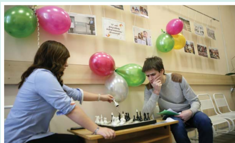
К юбилею факультета в холле была развернута фотовыставка

Традиционно в марте проходит празднование Дня рождения факультета информационных технологий – «День IT-специалиста». Помимо студентов и преподавателей на праздник приглашаются абитуриенты, планирующие поступать на факультет информационных технологий, а также гости из других вузов. Так заведено, что День IT-специалиста проводится в формате пленарного заседания с последующими секционными заседаниями: научными конференциями, студенческими семинарами, выставками достижений кафедр факультета.