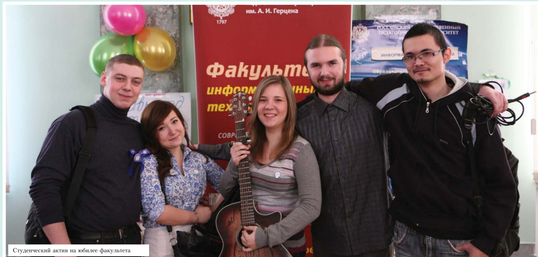
Студенческий актив на юбилее факультета