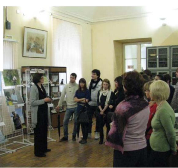
Выставка-отчет о международном проекте «Лица юности»

С целью внедрения новых форм работы в процесс обучения иностранным языкам на протяжении всей декады проводились необыкновенно интересные, яркие и познавательные викторины, экскурсии и мастер-классы. Особо запомнилась студентам дидактическая игра «Путешествие во Францию», а также викторины по страноведению Великобритании, США и Австралии. Участники викторин – студенты факультетов безопасности жизнедеятельности, физики, химии, математики и коррекционной педагогики – вместе с преподавателями кафедры английского языка для естественных факультетов необычайно живо и правдоподобно смогли на несколько часов погрузиться в атмосферу национального колорита стран изучаемого языка.