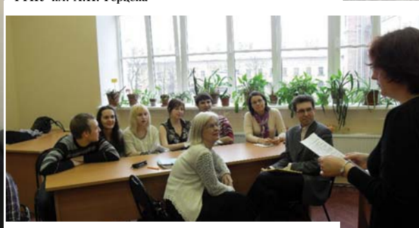
Интеллектуальная игра Jeopardy: студенты и преподаватели в одной команде

го и Ханты-Мансийского государственного университетов, учителя финского и английского языков и школьники средних школ г. Санкт-Петербурга, преподаватели и студенты из Кореи, Китая, представители отдела молодежных проектов Александринского театра и представители издательства «Макмиллан» и «Лонгман» в Санкт-Петербурге. В течение двух лет как форма проведения мероприятий, так и тематика декады были чрезвычайно широки и разнообразны. Примечательно, что все творческие задания и учебно-образовательные мероприятия организованы в рамках определенных целевых направлений. Формированию уважения к культуре других стран и развитию интереса к зарубежной литературе послужил конкурс декламации – чтение художественного текста на изучаемом иностранном языке. IV междувузовский интернет-