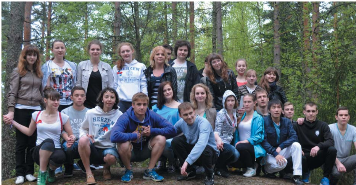
Летняя смена 2013. Студенты РГПУ им. А.И. Герцена

17 мая в ЗЦДЮТ «Зеркальный» стартовал выездной летний семинар-практикум для студентов Герценовского университета. Опытные вожатые «Зеркального» в течение четырёх дней должны были делиться со студентами-герценовцами своими знаниями и навыками. А поскольку главная задача вожатого – понять, чего хотят дети, новичкам предстояло полностью пройти путь маленького ребёнка, впервые приехавшего на отдых в оздоровительный лагерь.