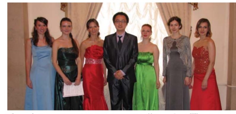
Студенты факультета музыки, представившие композицию-концерт «Музыкальный салон XIX века»

Петербурга». «Реальная» состояла из двух частей: первая – по территории РГПУ имени А.И. Герцена, во время которой студенты рассказывали об истории нашего университета, а вторая – о некоторых достопримечательностях нашего города, примыкающих к Герценовскому университету: о Казанском соборе, Доме Книги, Соборе Спаса-на-Крови, Конюшенной улице. Студенты также участвовали в ориентировании по городу City Quest, который был организован магистрантами 1 курса специальности «Краеведение» факультета социальных наук.