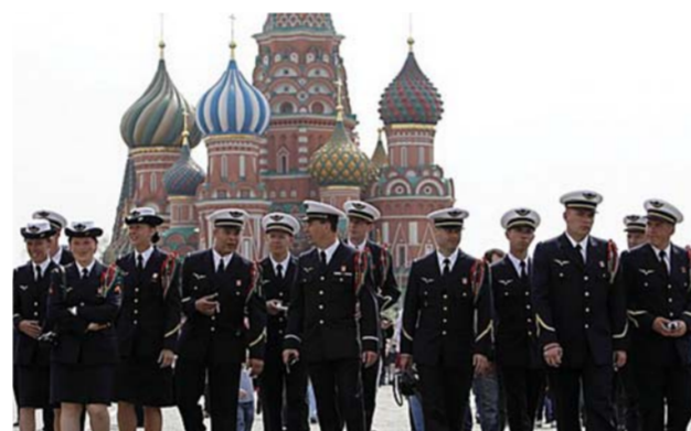
Полк «Нормандия-Неман» на ренетции парада, посвященного 65-летию Великой Победы.