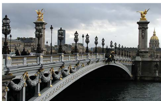
Мост Александра III в Париже.

нельзя не отметить популярность в Париже русских балетных сезонов Дягилева.