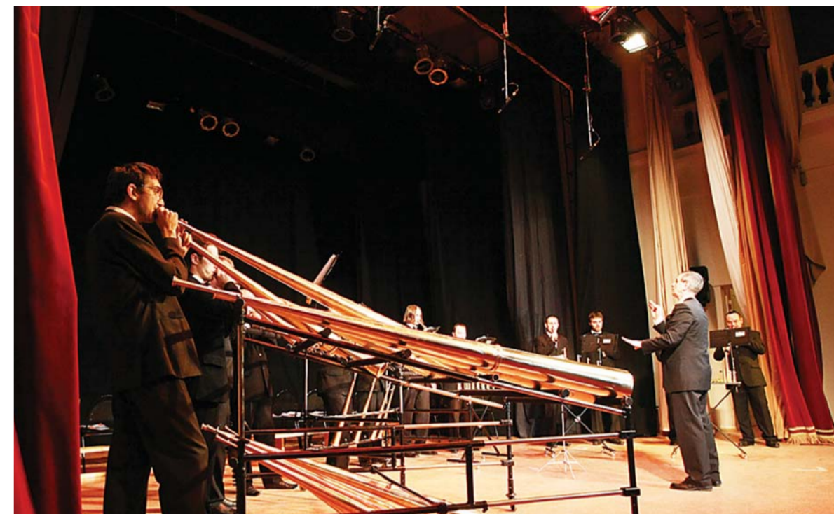
Выступление в Колонном зале РГПУ им. А.И. Герцена 17 ноября.

В середине минувшего ноября в РГПУ им. А.И. Герцена