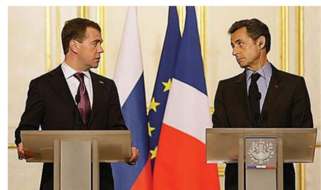
Президент РФ Д.А. Медведев и президент ФР Никола Саркози.