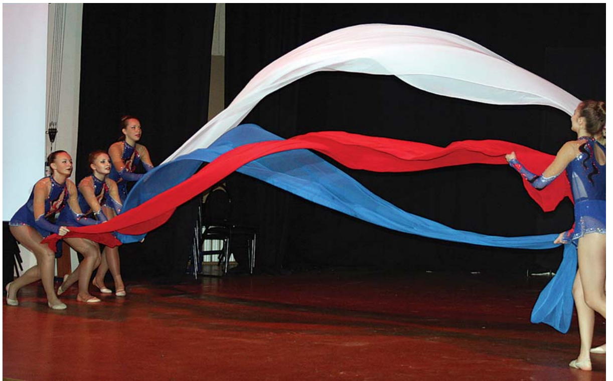
Выступление женской команды по художественной гимнастике Университета путей сообщения.