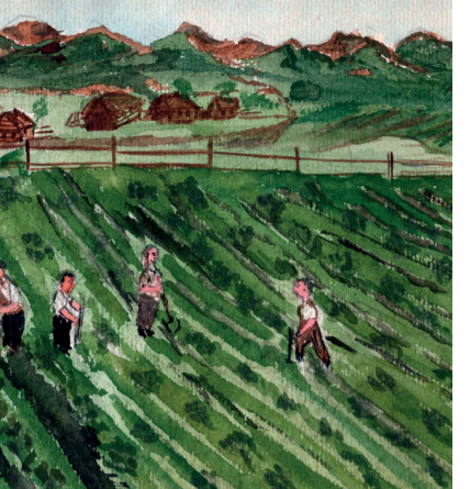
Жидкие такие, невидные бабёнки, а работу сделали за настоящих мужиков.

В дни блокады в Ленинграде работало несколько педагогических образовательных учреждений, но ведущим среди них был