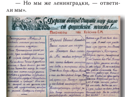
В оформлении материала использованы рисунки детей, эвакуированных в с. Ляды (Пермская область), письма из детского дома детей, эвакуированных в с. Ней (Ярославская область)

— Но мы же ленинградки, — ответили мы. — Ну, нет! Мы её и сами бы выпили, будь она у нас.