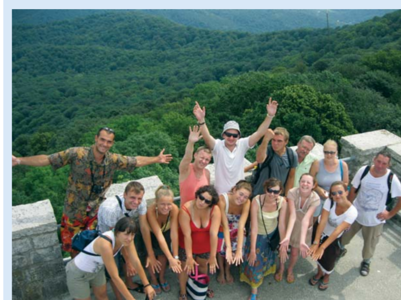
На горе Ахун в Сочи.