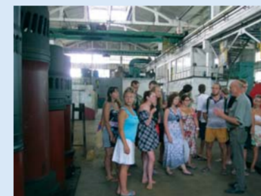
Посещение судоремонтного завода в Туапсе.

Факультет географии – один из самых интересных в Герценовском университете. Основным его достоинством я считаю возможность выезжать на полевые практики. Это не только шанс применить полученные во время учёбы знания, но и посетить уникальные уголки нашей огромной страны.