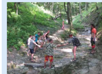
Изучение высотной поясности Малого Кавказа.