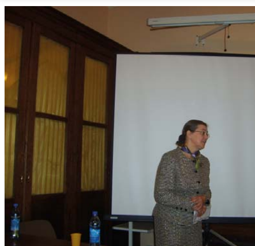
На диссертационном совете в Москве