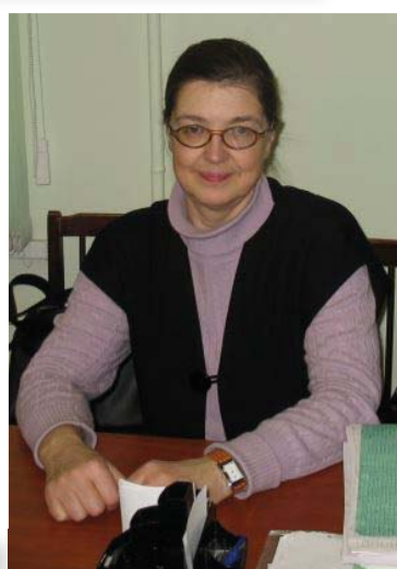
На диссертационном совете РГПУ им. А.И. Герцена