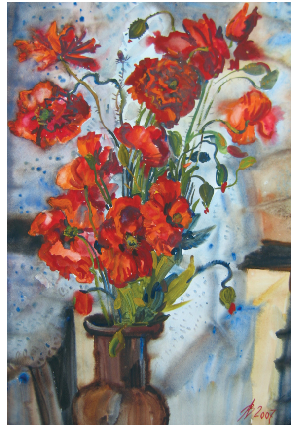
«Маки», бумага, акварель, 2007