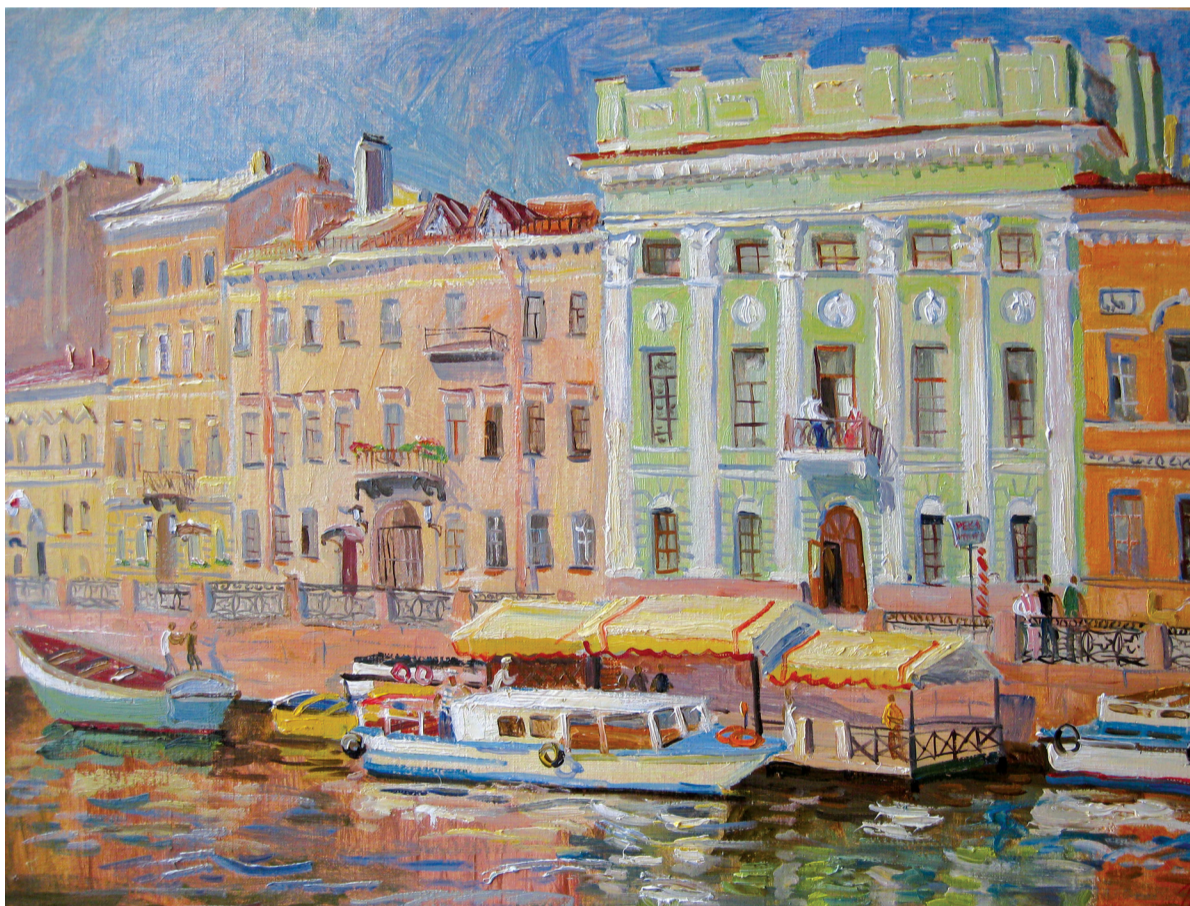
«Катера на Мойке», холст, масло, 2011

ного художника, она не расстанется со своим университетом. Потому что университет — ее гавань, беспокойная, но именно с той степенью интеллектуального напряжения, которая так много дает ей как живописцу.