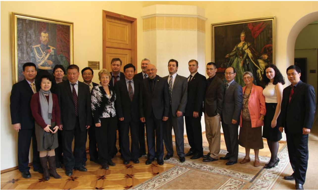
Совместное фото после деловой встречи

В РГПУ ИМ. А.И. ГЕРЦЕНА СОСТОЯЛАСЬ РАБОЧАЯ ВСТРЕЧА С ГОСТЯМИ ИЗ КИТАЯ