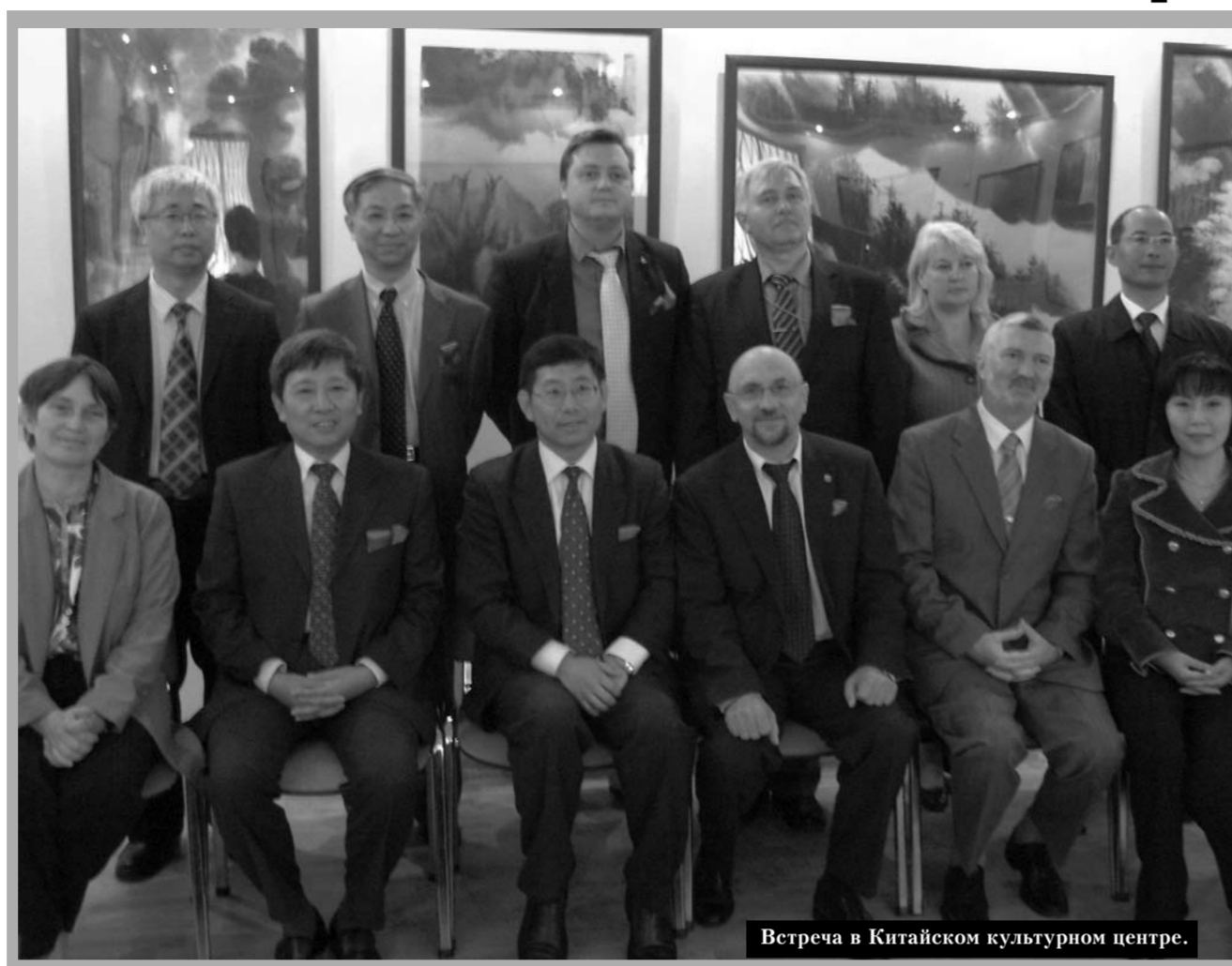
Встреча в Китайском культурном центре.

Когда я был в Шанхайском университете, то видел бюст Пушкина у факультета русского языка. Мне было очень приятно. Пушкин для меня — гениальный поэт вне времени, верх совершенства, которого я для себя периодически открываю. Глубина, тонкость чувства и изящность. У меня осталось самое приятное воспоминание об этом университете. У китайских гостей, вероятно, такое же впечатлительное сложится о нас. Установка памятника Конфуцию — важное событие для университета. Во-первых, китайские университеты — наши традиционные и стратегические партнеры. У нас обучается очень много китайских студентов, и если мыслить прагматично, то это дополнительные финансовые средства. Во-вторых, для каждой нации важно быть в соприкосновении и диалоге с культурами другой страны, так как это представляет из себя ресурс, перспективу и развитие. Происходит взаимобогащение как для России, так и для Китая. Китайские студенты приезжают