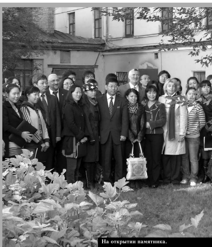
На открытии памятника.

Некто спросил: «Правильно ли говорят, что за зло нужно платить добром?» Учитель сказал: «А чем же тогда платить за добро? За зло надо платить по справедливости, а за добро — добром».