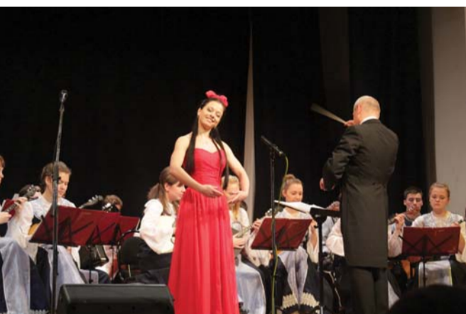
Концерт к юбилею института музыки, театра и хореографии

95-летие факультета математики, 50-летие факультета химии и 25-летие факультета музыки, не так давно ставшего институтом музыки, театра и хореографии. Три праздничных вечера в Колонном зале, подаривших море положительных эмоций студентам, преподавателям, руководству Герценовского университета, а также выпускникам, которых в alma mater пришло очень много.