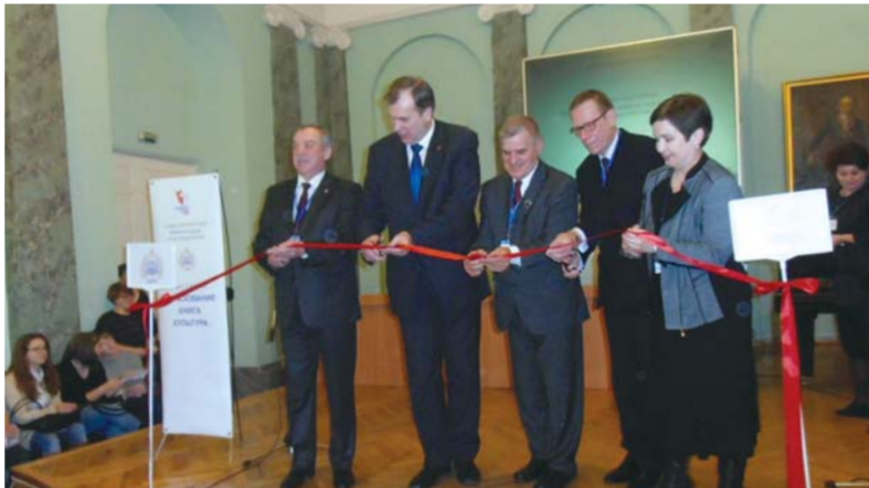
Торжественное открытие выставки