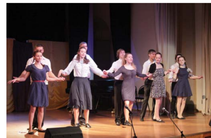
На сцене – студенты факультета математики

СРАЗУ ТРИ ФАКУЛЬТЕТА ГЕРЦЕНОВСКОГО УНИВЕРСИТЕТА В ПРЕДДВЕРИ НОВОГО ГОДА ОТМЕТИЛИ ЮБИЛЕИ