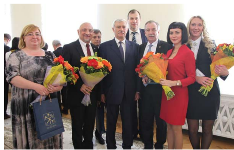
Торжественная церемония вручения прений Правительства Санкт-Петербурга. Герценовцев поздравляет губернатор Санкт-Петербурга Георгий Полтавченко, председатель Законодательного собрания Санкт-Петербурга Вячеслав Макаров...