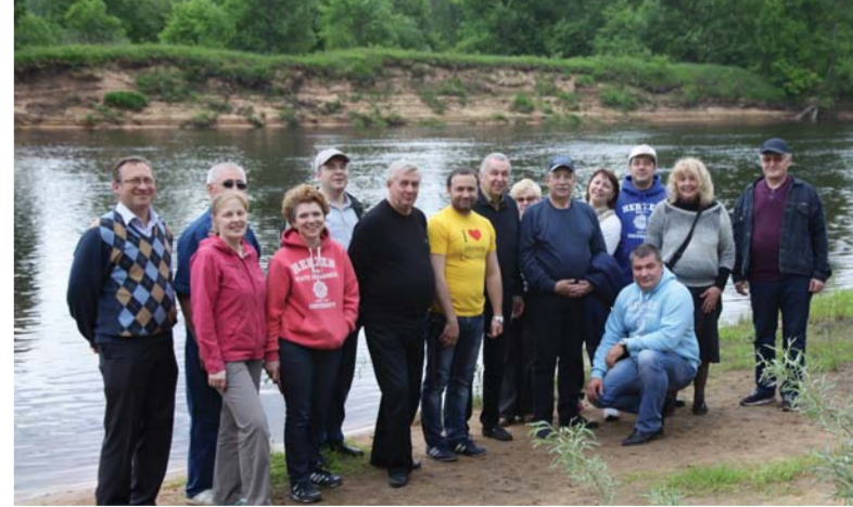
Руководство РГПУ им. А.И. Герцена – на гостеании «Железо» факультета географии РГПУ им. А.И. Герцена в Лузском районе Ленинградской области

Главным достижением я бы назвал то, что Герценовский университет сегодня является педагогическим вузом-лидером, университетом с безупречной репутацией и высокими позициями в профессиональном сообществе.