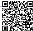
График защиты проектов:

https://sferum.ru/ ?call_link=8QxIFM3y0jpUboXgbBfmXpThwwkkmo1VT6cliCqvV88