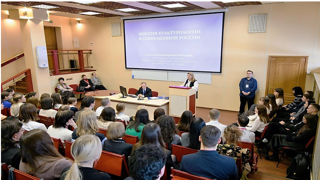
Открытая лекция А.В. Бондарева на тему «Миссия культурологии в современной России» (6 февраля 2025 г., Санкт-Петербургский Гуманитарный университет профсоюзов)