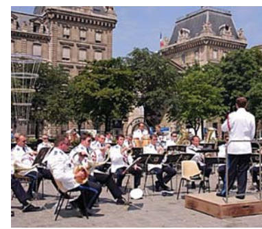
Праздник музыки в Париже. Оркестр играет на площадке возле мэрии.