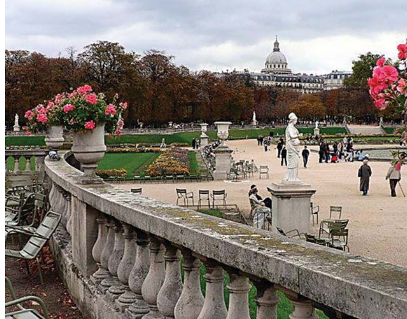
Люксембургский сад весной, Париж.

Естественно, послевоенная мода создавалась не только Диором. Пятидесятые — это время расцвета и славы Модного дома