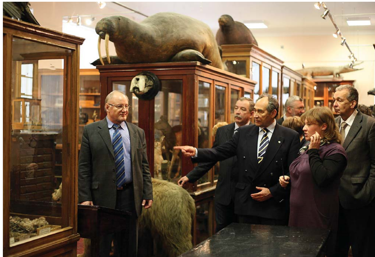
Экскурсия в зоомузей.