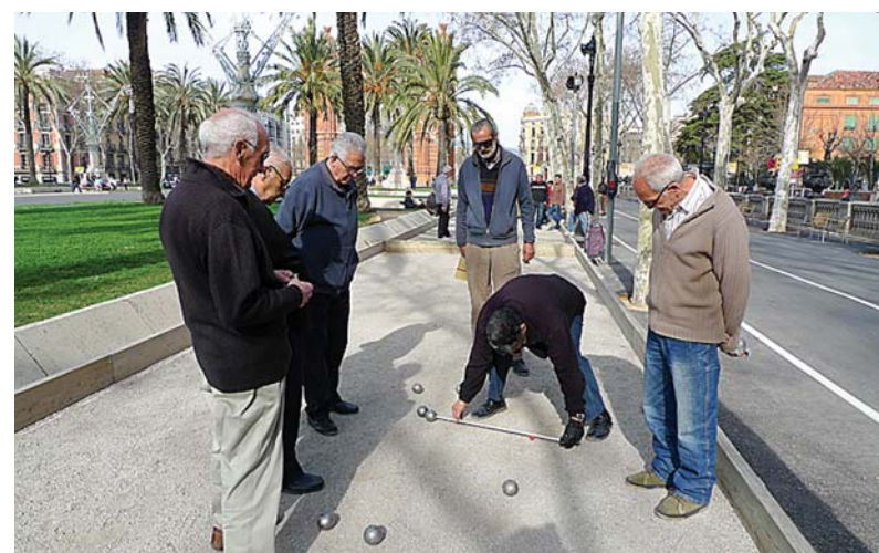
Игроки в петанк на улице.