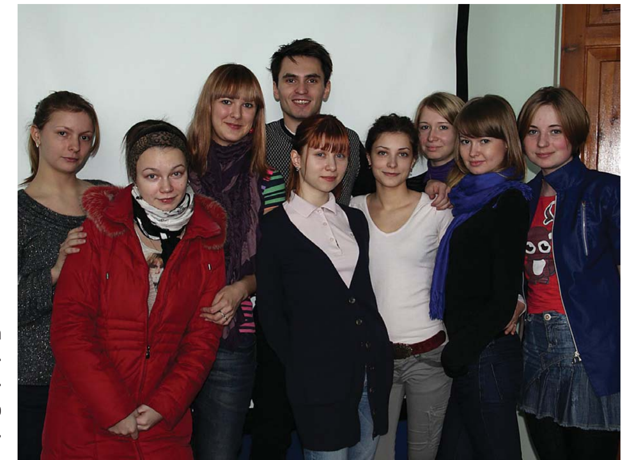
Студенты 4 курса отделения «Культурология», специальности «Мировая художественная культура».

в культуре своей страны, региона, этноса. Понимание этих процессов и изучение культуры своей страны, на мой взгляд, являются необходимыми и для формирования толерантности, включения в культурные процессы России