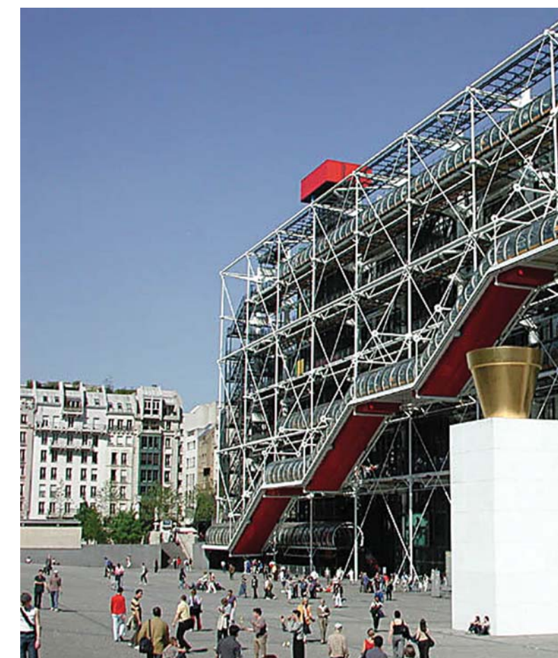
Центр Жоржа Помпиду.