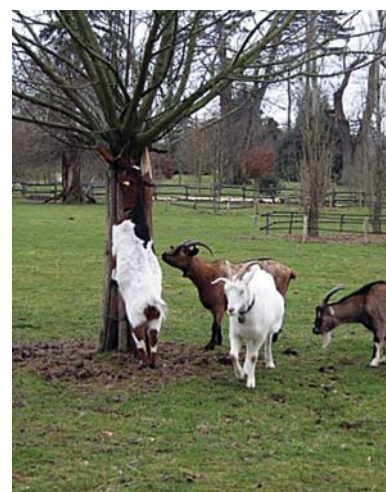
Козы в парке Версаля, владения Марии-Антуанетты.