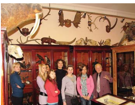
Группа студентов в зоологическом музее.