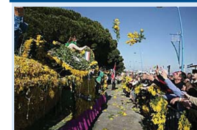
Забавная традиция — кидаться мимозой — реализуется на Фестивале мимозы.

Музыку в этот день можно услышать повсюду: в концертных залах, на улицах, в квартирах. Все, кто умеет играть — играют, кто умеет петь — поют, танцевать — танцуют; те, кто лишен всяческих талантов — слушают исполнителей, а все вместе наслаждаются музыкой и радуются жизни. Проводятся парады оркестров, концерты, в которых принимают участие и известные и не очень