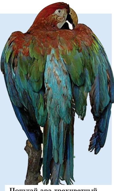
Попугай ара трехцветный.

Ara tricolor — кубинский или трехцветный ара. Обитал на острове Куба. До 1800 года был довольно широко распространен, однако быстрое заселение острова, уничтожение лесов, которые заменялись кофейными, банановыми и другими плантациями, а также преследование попугая ради яркого оперения, привели к исчезновению вида. К 1849 году оставались всего 19 особей, обитающих в отдаленных районах. Восстановить популяцию не удалось. Последний попугай был убит приблизительно в 1864 году в окрестностях болота Сьенага-де-Сапата.