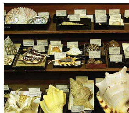
Экспозиция раковин моллюсков.

В наши дни, как и сто лет назад, студенты, школьники, учащиеся лицеев и гимназий приходят в музей знакомиться с уникальными экспонатами и