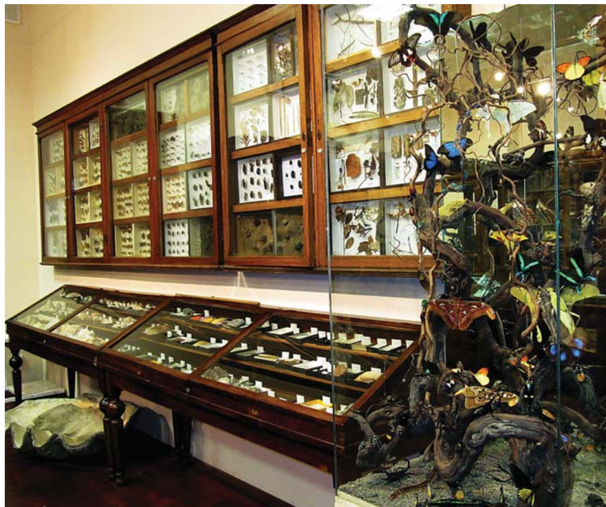
Экспозиция насекомых музея.

Среди многочисленных видов птиц зоологического музея