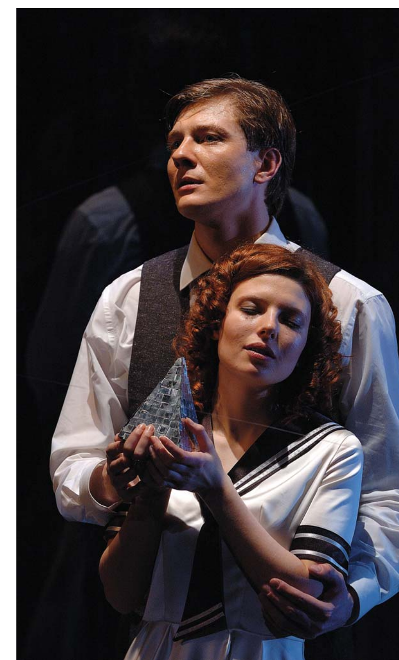
На фото – сцены из спектаклей «Синие розы» и «Поздняя любовь».