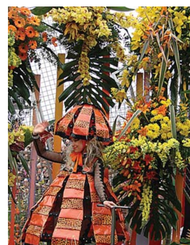
Цветочный карнавал в Нице, проводящийся в конце Фестиваля мимозы.