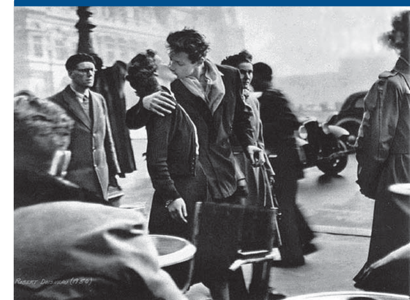
«Поцелуй влюбленных у мэрии Парижа». Снимок был сделан известным французским фотографом Робером Дуано в 1950 году, работавшим в то время над серией фотографий о парижских влюбленных. Только спустя тридцать с лишним лет фото заметила одна компания по производству плакатов. Именно с этого момента и началась всемирная известность снимка. Многие считали его спонтанным, однако на самом деле фотография была постановочной.

числе произведения таких авторов, как Сальвадор Дали, Пабло Пикассо, Василий Кандинский, Марк Шагал, Казимир Малевич, Анри Матисс и др.