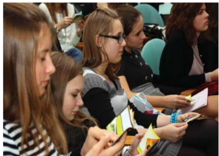
Участники проекта «День в университете».