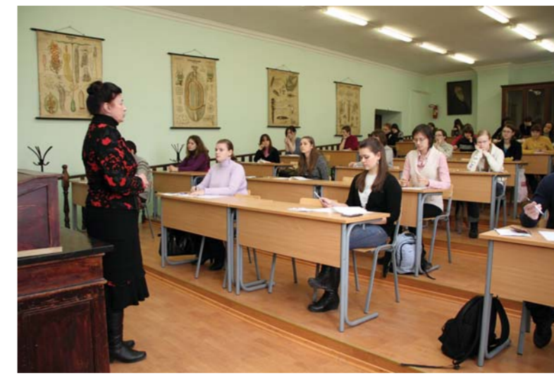
Напутствие преподавателей Герценовского университета.

Как на бюджетной, так и на платной основе ведется под-