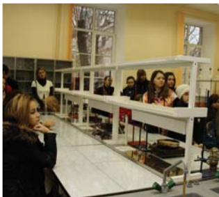
Старшеклассники гимназии № 619 в лаборатории факультета химии.