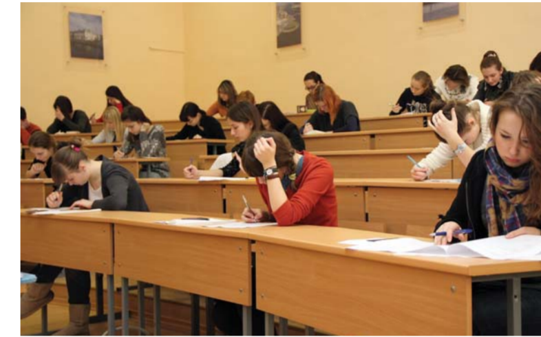
Участники Герценовской олимпиады за работой над заданиями.