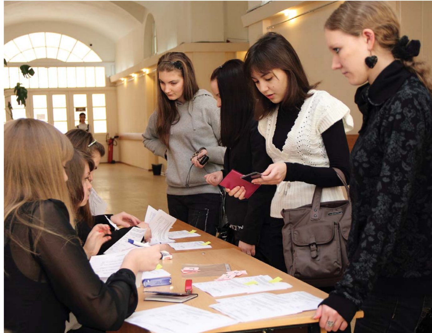
Регистрация участников Герценовской олимпиады.

А теперь перейдем ко второму – не менее интересному вопросу: какие преференции получают победители и призеры олимпиад. Порядок проведения олимпиад школьников, включенных в Перечень, гласит: льготы при поступлении в вузы РФ могут быть двух порядков. Льгота первого порядка – быть зачисленным без вступительных испытаний, льгота второго порядка – быть приравненным к лицам, набравшим максимальное количество баллов по предмету, соответствующему про-