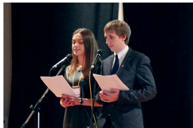
Ведущие церемонии открытия