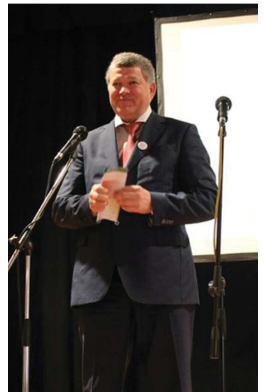
Председатель Комитета по молодежной политике Санкт-Петербурга А.Н. Пархоменко