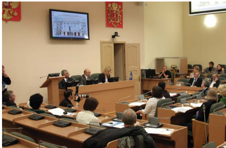
На конференции в Гербовом зале.

На несколько вопросов корреспонденту газеты «Пе-