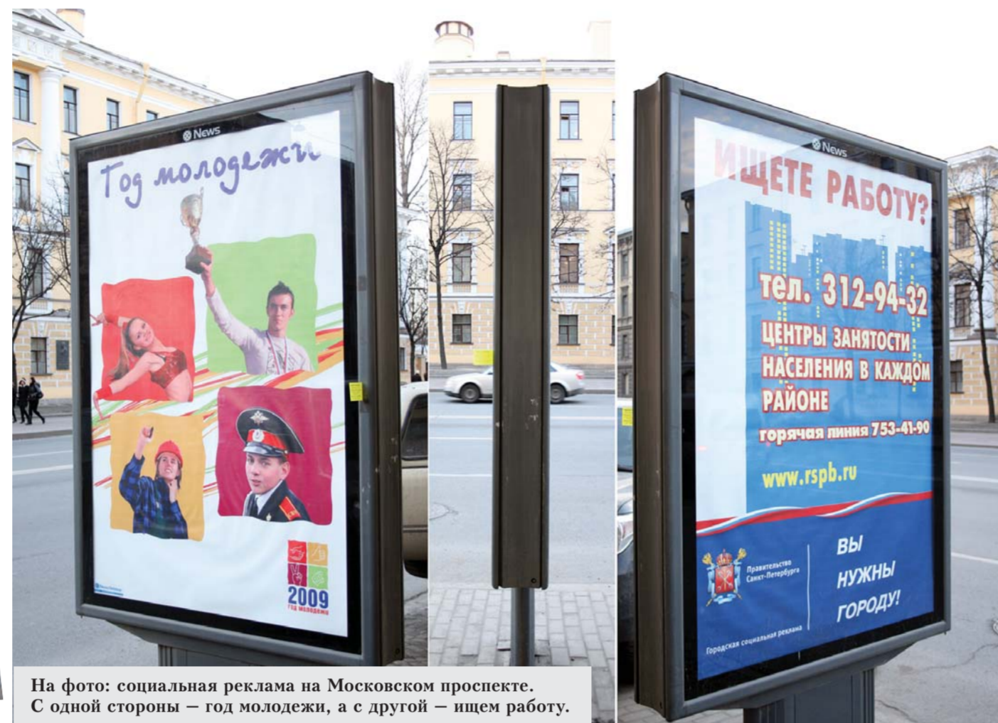
На фото: социальная реклама на Московском проспекте. С одной стороны – год молодежи, а с другой – ищем работу.