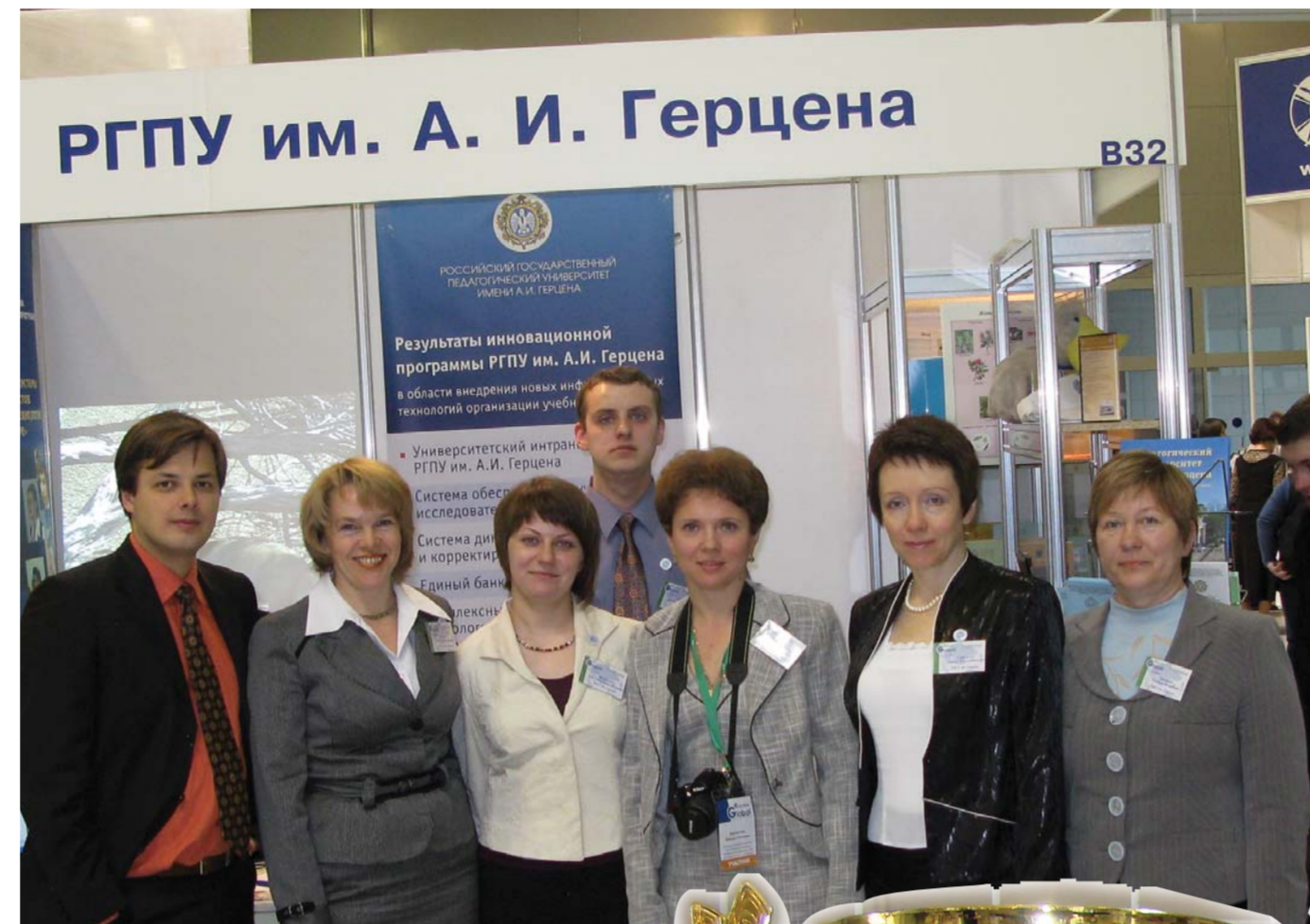
Делегация РГПУ им. А.И. Герцена на Международном конгрессе – выставке «Global education – Образование без границ 2009».

Представленная в экспозиции РГПУ им. А.И. Герцена серия научно-методических материалов «Междисциплинарные исследования и гуманитарные технологии» (руководитель разработки