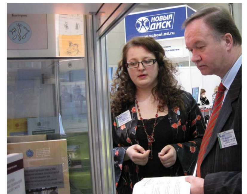
Представление серии научно-методических материалов «Междисциплинарные исследования и гуманитарные технологии».

ных ресурсов, но он же позволяет учителю самому пополнять медиатеку, создавать и редактировать тестовые задания разных видов (в готовых шаблонах), создавать уроки в виде презентаций с гиперссылками на имеющиеся ресурсы медиатеки и тестовые задания.