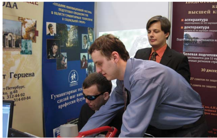
Демонстрация работы методико-технического комплекса для незрячих и слабовидящих.