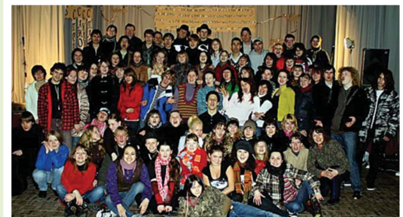
Творческий выезд в Вырицу.

студентов РГПУ отправилась в путешествие в Вырицу. Там, на творческом выезде, все проявили максимум своих талантов, творца и импровизируя на грани физических и эмоциональных возможностей. Три дня непрекращающегося марафона зарисовок, спектаклей и импровизаций на лоне природы, в живопис-