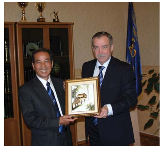
Обмен памятными подарками.