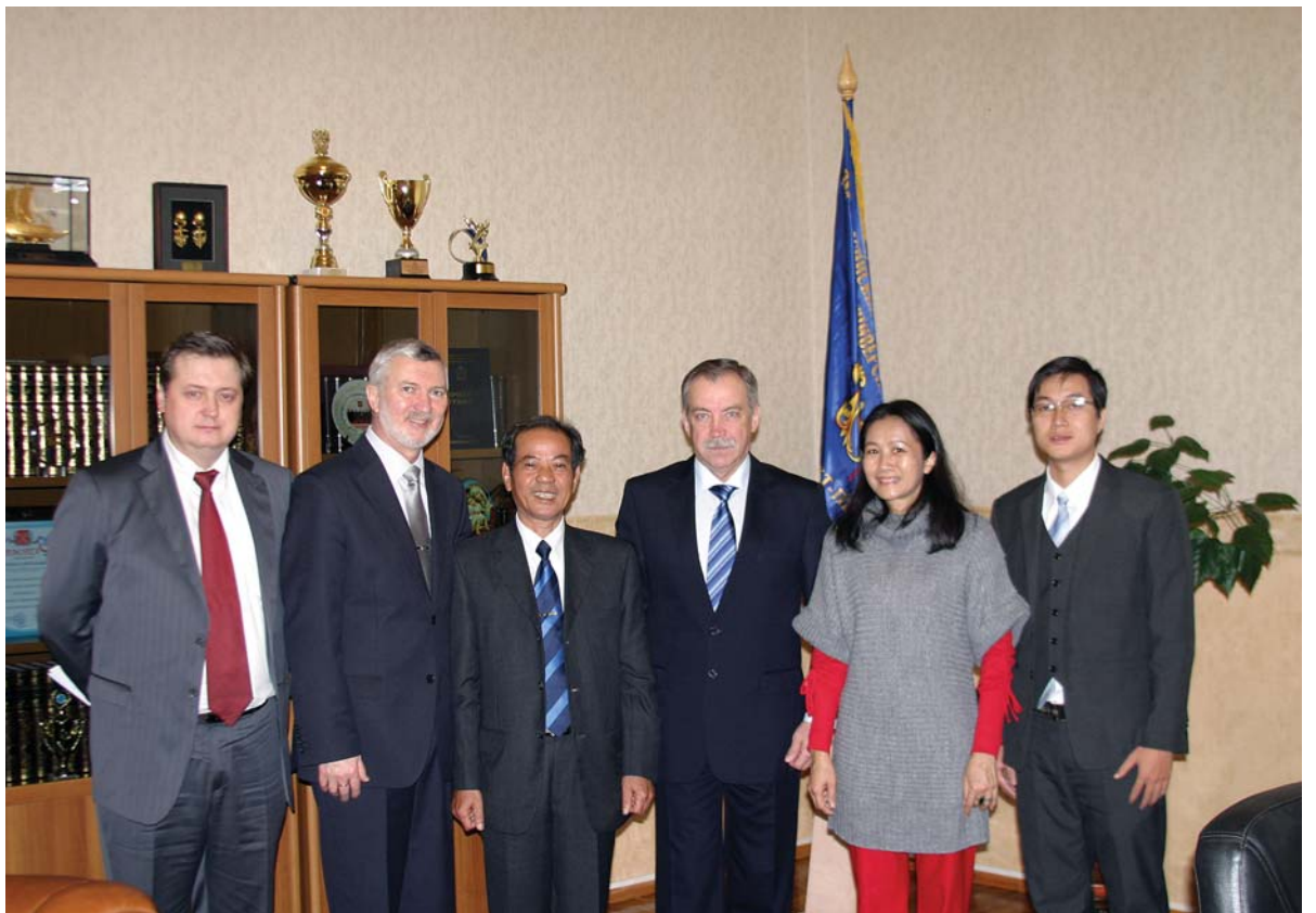
На встрече вьетнамской делегации с ректором Герценовского университета.

– После окончания войны во Вьетнаме русский стал одним из главных международных языков. Затем, после распада СССР, он потерял