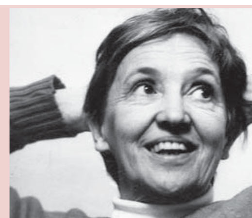
Элви Синерва (1912– 1976)