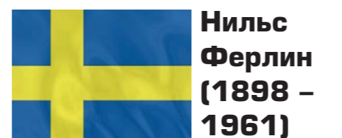
Нильс Ферлин (1898 – 1961)

В нашем доме 12 часов, но времени всё равно не хватает. Идешь на кухню за кружкой какао для щупленького сына, а, вернувшись в комнату, обнаруживаешь, что он уже слишком взрослый для какао – ему подавай пиво, девок и революцию. Нужно использовать время с умом, пока оно есть. Дочь приходит из школы, бежит играть в классики. Немного погодя она возвращается и спрашивает, не присмотришь ли ты за ребёнком, пока она с мужем сходит в театр, и пока они в театре, он с горем пополам переходит в 3 "Г". Нужно использовать время с умом, пока оно есть. Вот ты фотографируешь свою еще молодую жену в задорной цыганской шали, но едва успеваешь проявить кадр, как она тут же заявляет, что вот уже и её очередь выходить на пенсию, а затем в ней понемногу просыпается вдова. Нужно использовать время с умом, пока оно есть, но оно всё время уходит, куда оно девается, и было ли оно когда-нибудь вообще, может, мы потратили слишком много времени, пытаясь выиграть время. Нужно использовать время вовремя, побродить немного, не глядя на часы и дорогу, и, когда настанет время, позвонить домой и услышать: "Вы позвонили по номеру 95949392 Такого абонента не существует". Гудок.