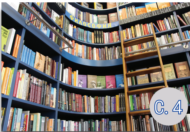
УНИВЕРСИТЕТ – ЭТО ЛЮДИ И ИХ УСПЕХИ ИНТЕРВЬЮ С РЕКТОРОМ СЕРГЕЕМ БОГДАНОВЫМ