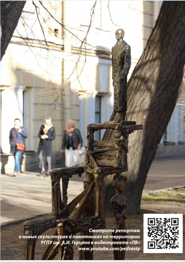
Смотрите репортаж о новых скульптурах и памятниках на территории РГПУ им. А.И. Герцена в видеопроекте «ПВ» www.youtube.com/pedvesty

Увековечивание памяти Николая Гумилева в Санкт-Петербурге — ответственная задача, решением которой занимался один из выдающихся современных петербургских скульпто-