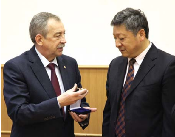
Обмен памятными подарками