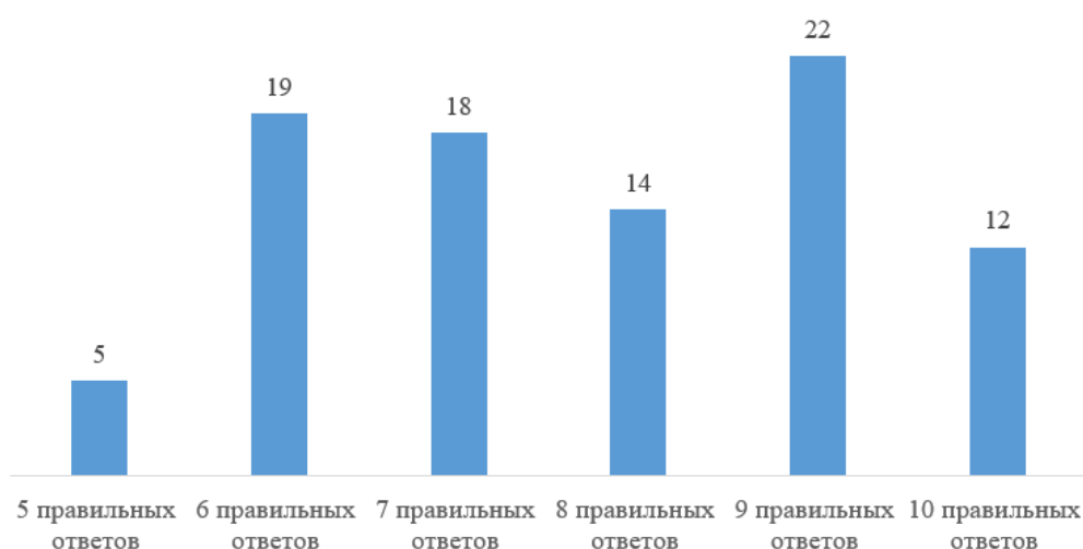
Рис.2. Распределение результатов тестирования (количество правильных ответов) у слушателей семинара (в%)