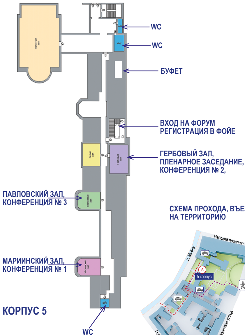
СХЕМА ПРОХОДА, ВЪЕЗДА НА ТЕРРИТОРИЮ